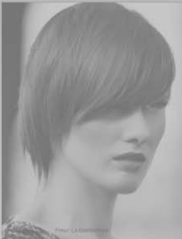
Friseur: LA Blondine