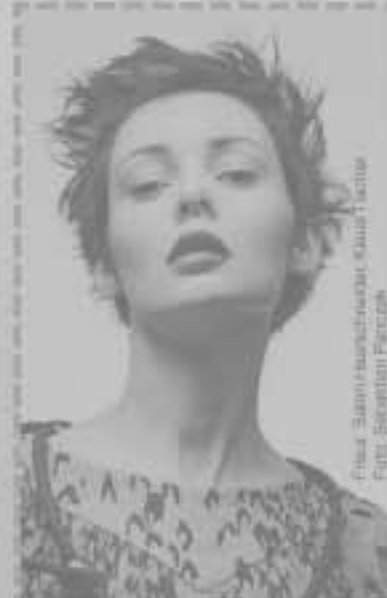
Frisur: abstrakthauswettbewerb Klausur 1 Seite