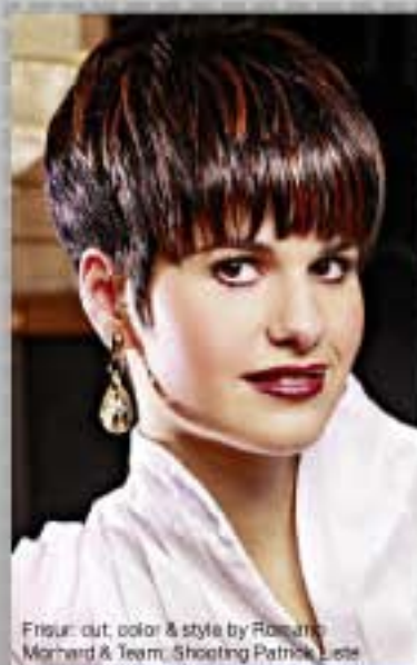
Frisur: cut, color & style by Rosemarie Morhard & Team, Shooting Patrick Lese