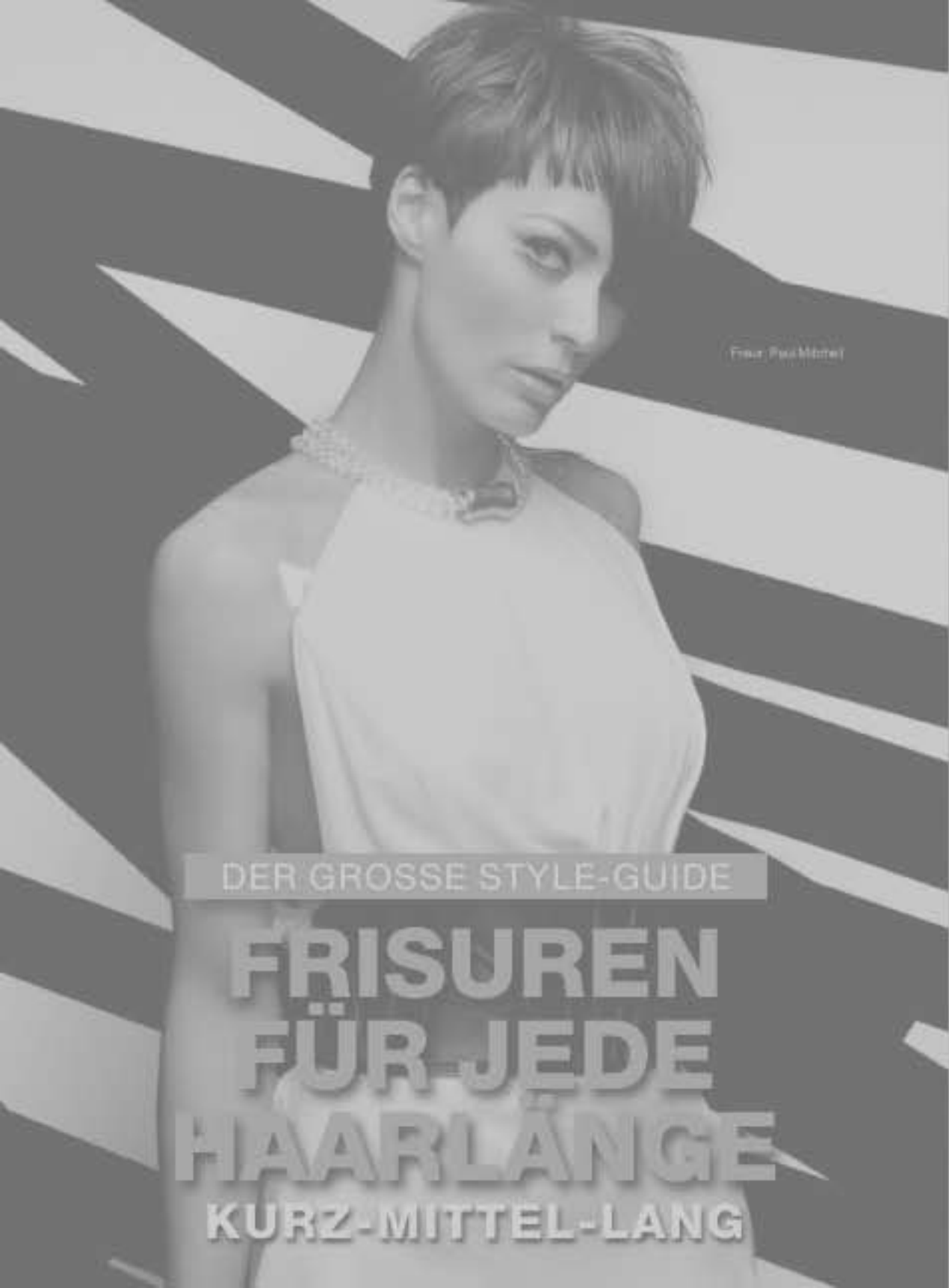
Frisur: Paul Mitchell