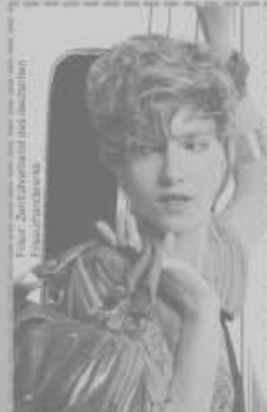
Frisur: Zwickelmann (des Deutschen Friseurhandwerks)