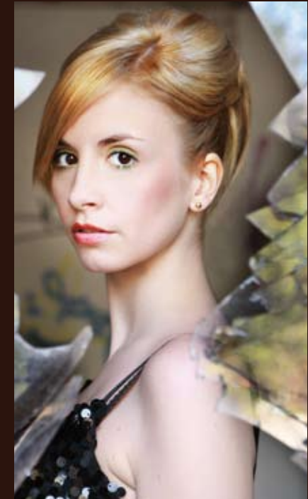
cut, color & style romano morhard & team